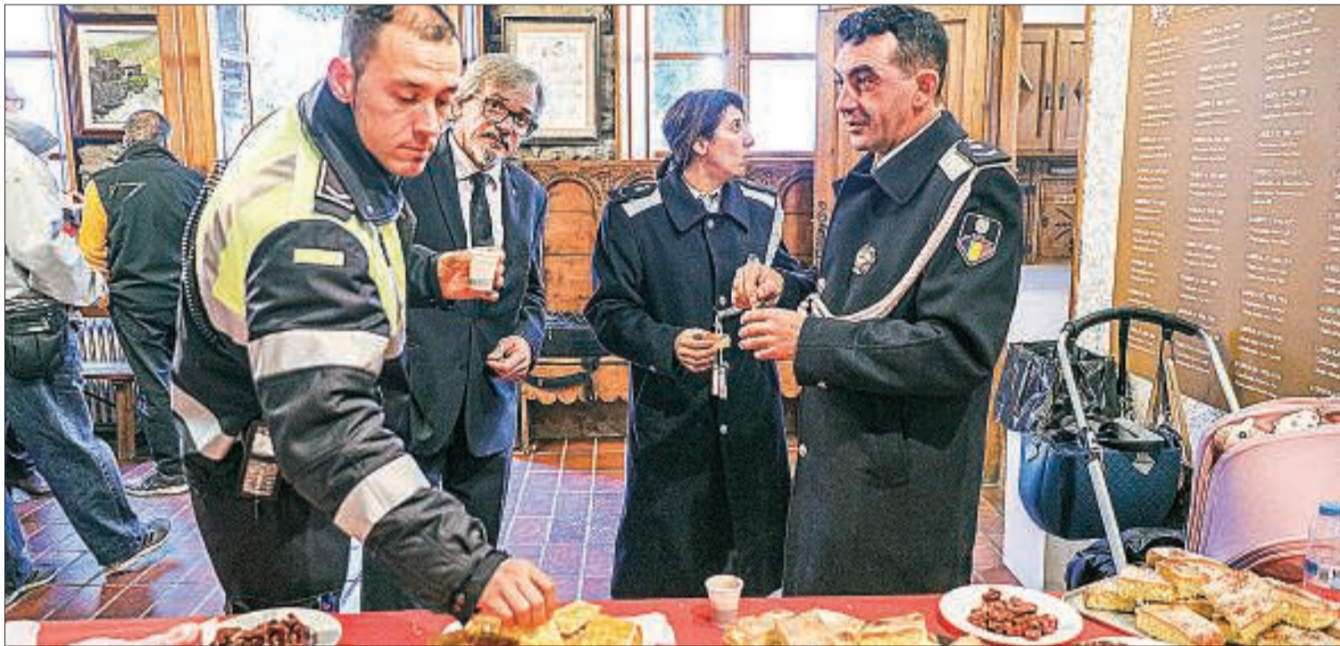
El comú de Sant Julià de Lòria és un dels que 'premlen' els electors amb beguda i menjar.

CÀSTING Informació de servei per fixar la residència en funció del lloc on millor es vota. Si voleu evitar pressió dels candidats, lluny d'Escaldes i la capital. Si us mou la teca, Sant Julià o Canillo.